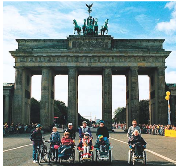
Die Integrationsmaschine: Alt und Jung vereint beim Gruppenbild mit Monument

Und auf Nummer Sicher gehen die eigens für das ROLLFIETS gefertigten Zwillingss-Trommelbremsen. Auf Wunsch ist selbst der 'Rückenwind' einbaubar. In Form eines Elektro-Hilfsantriebs.