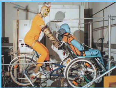
Erfolgreich bestanden: das ROLLFIETS im Dauer-Test am Institut für Biomedizinische Technik der TU Berlin! Optimale Sicherheit auch nach 1.000.000 Lastwechseln.