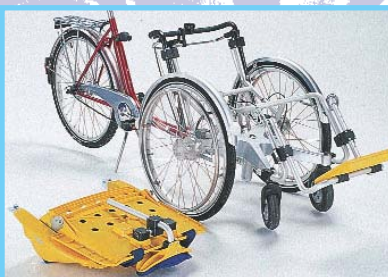
Mit wenigen Handgriffen lässt sich der Schalensitz abmontieren.

Das sportliche Design überzeugt. Die Funktion ist bis ins Detail durchdacht.